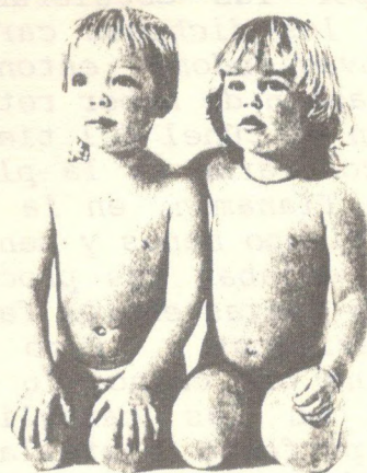
Kim Basinger y Tom Cruise desnudos con 1 año de edad

Espero que esta afectuosa carta contribuya a aclarar mi posición y fomente la convivencia en el centro. -----